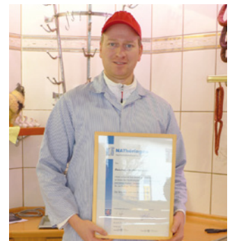
1. Teilnahme Fleischerei Steffen Schumm, Langewiesen www.steffenschumm.de