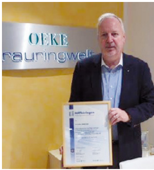
2. Teilnahme Juwelier OEKE KG, Weimar www.oeke.de