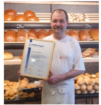
1. Teilnahme Bäckerei Henning Gerth, Starkenberg/OT Kostitz www.baekereiGerth.de