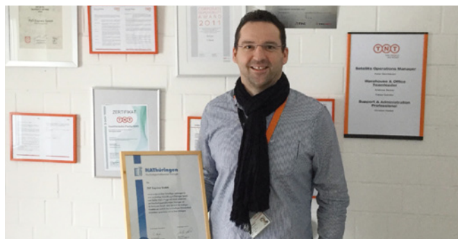
5. Teilnahme, Dauerstatus TNT Express GmbH, Erfurt www.tnt.de

Eine Einzelkundenübergabe fand für folgende Teilnehmer statt: