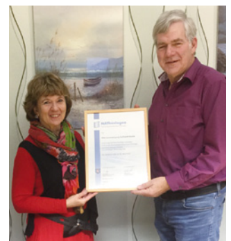
1. Teilnahme Wärmeversorgung Sollstedt GmbH, Sollstedt