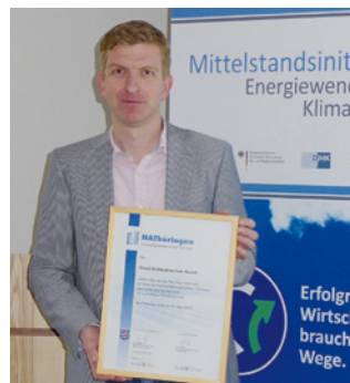
1. Teilnahme Gesell Gebäudetechnik GmbH, Dornburg-Camburg www.gesell-camburg.de