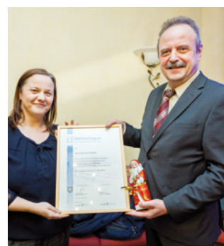
3. Teilnahme Jena-Optronik GmbH, Jena www.jena-optronik.de