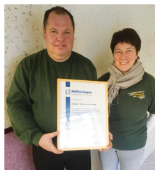
1. Teilnahme Knobloch - Naturbeschichtungen, Neustadt/Orla www.nawofa.de