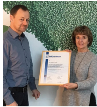
2. Teilnahme mtm plastics GmbH, Niedergera www.mtm-plastics.eu