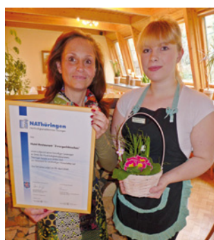
3. Teilnahme Hotel-Restaurant "Zwergschlösschen", Gera www.hotel4you.de