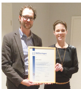
4. Teilnahme plottec GmbH, Heilbad Heiligenstadt www.plottec.com