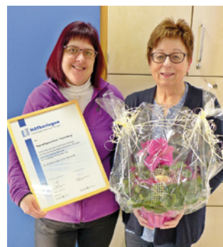
1. Teilnahme Tagespflegezentrum "Farrenberg", Cursdorf