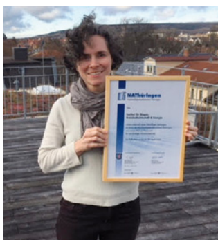
1. Teilnahme Institut für Biogas, Kreislaufwirtschaft & Energie, Weimar www.biogasundenergie.de