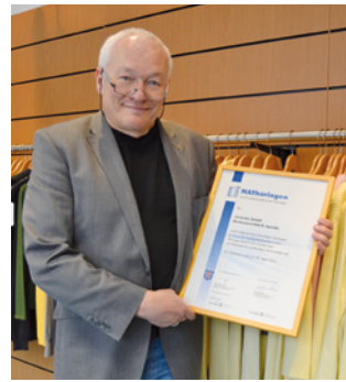
2. Teilnahme strickchic GmbH Strickwarenfabrik, Apolda www.strickchic.de