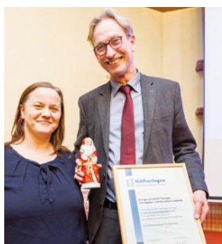
3. Teilnahme Bürogemeinschaft Thüringer Arbeitgeber- und Wirtschaftsverbände, Erfurt www.vwt.de