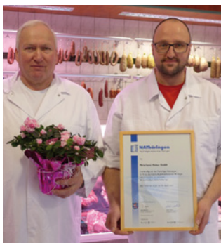
1. Teilnahme Fleischerei Weber GmbH, Reinholterode www.fleischerei-weber-gmbh.de